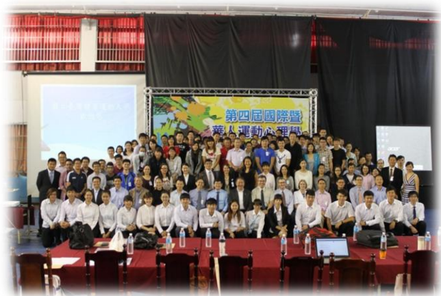
全體與會人員合照