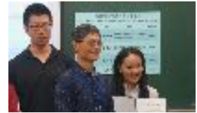
第五期運動心理諮詢老師 學科培訓與授證