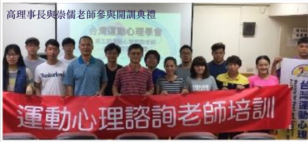
高理事長與崇儒老師參與開訓典禮