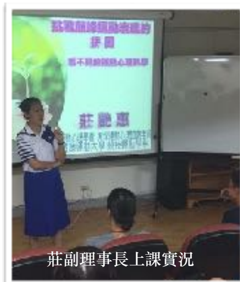
莊副理事長上課實況