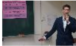
新科博士發表相關訊息 詳見發表序與活動照片