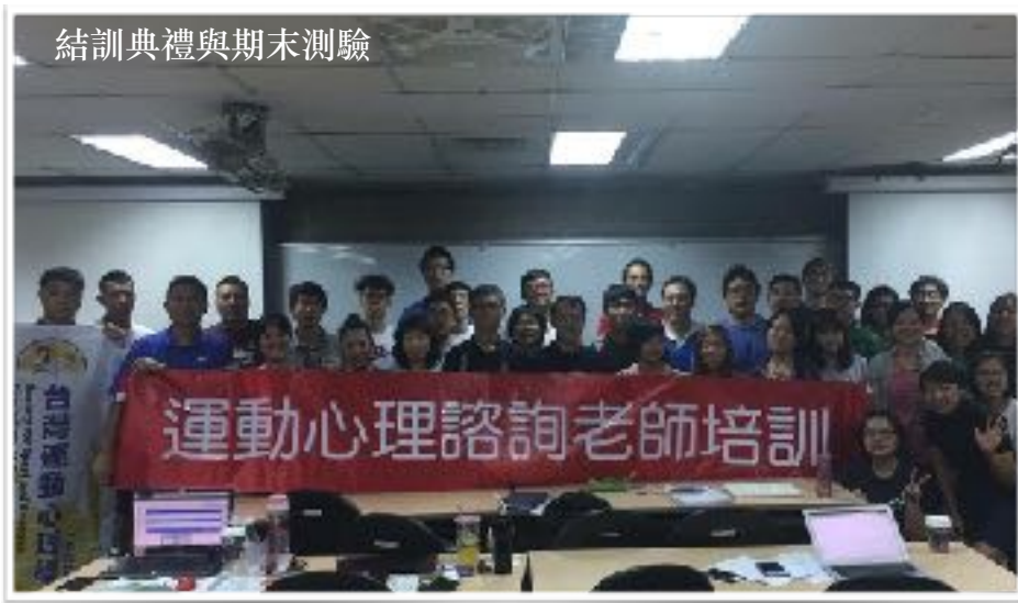
結訓典禮與期末測驗