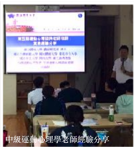
中級運動心理學老師經驗分享

本會兩年一次的運動心理諮詢老師的培訓工作，自106年六月起，假國立臺北教育大學體育學系系館，進行為期三個月的培訓工作。期間，除了安排紮實的運動心理學相關學科課程外，更邀請歷屆培訓完成的中級運動心理學老師，至培訓課程中進行心得分享與工作經驗的交流。本次參與培訓的學員，在經過辛苦的學科課程後，仍需通過相關課程的筆試與出缺席的考核後，始獲得學科通過的證明，並依志願分配指定實習指導老師處，進行為期160個小時的術科實習工作。目前該期學員正進行相關實習工作中。