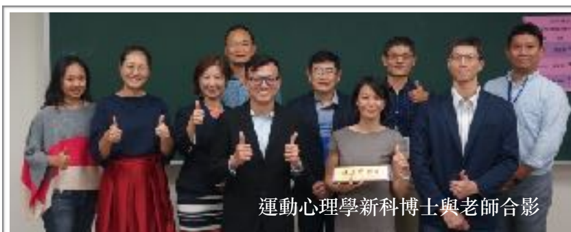
運動心理學新科博士與老師合影

新科博士發表在運動心理學界已經行之多年，是每年體育學術聯合年會或是本會舉辦相關學術活動，最受會眾歡迎和參與人數最踴躍的活動之一。由初獲博士學位的運動心理學研究者，進行長度15-30分鐘不等，聚焦於博士論文研究結果的發表，往往都是叫好又叫座。本年度總計有七位研究生力軍獲得博士學位，完成